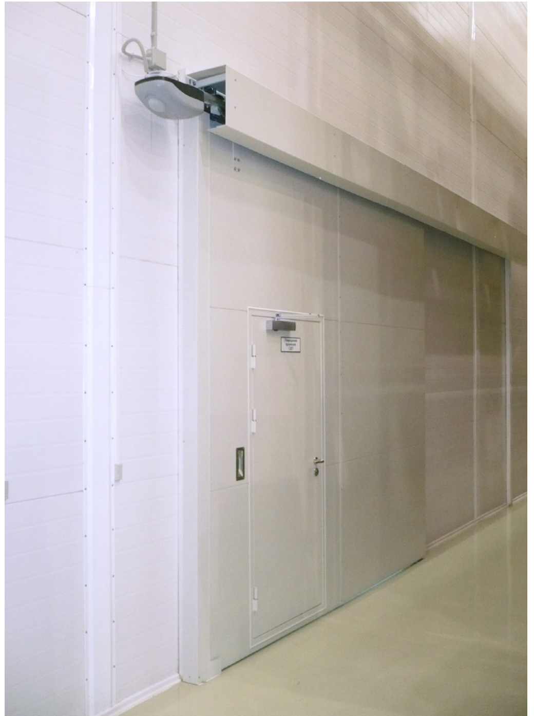
Storage Room of Finished Products; Pharmstandard; Kursk, Russian Federation; 2011