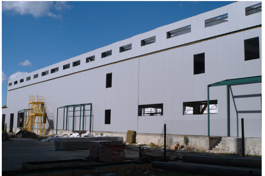
Storage Room of Finished Products; Pharmstandard; Kursk, Russian Federation; 2011