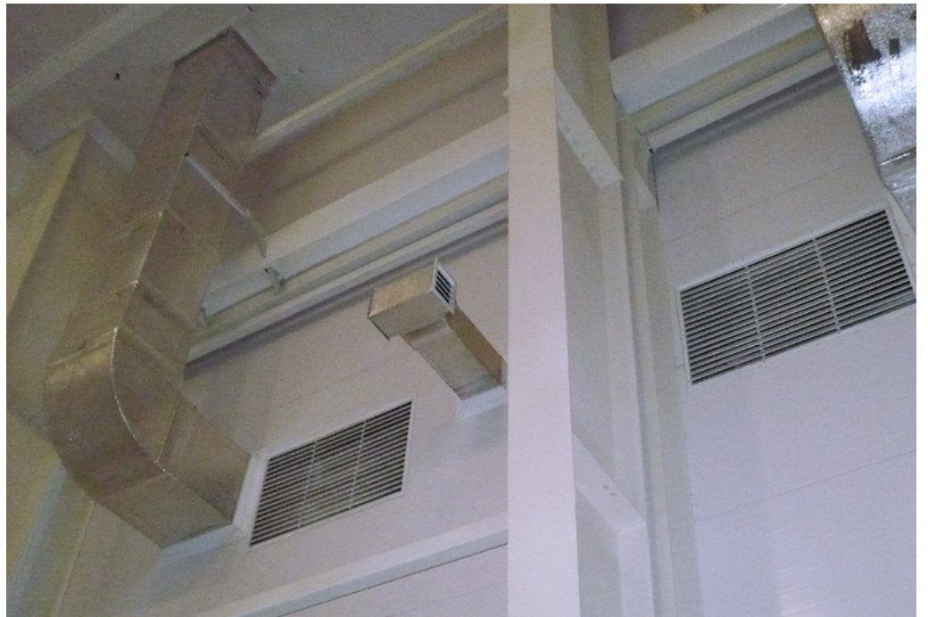
Storage Room of Finished Products; Pharmstandard; Kursk, Russian Federation; 2011