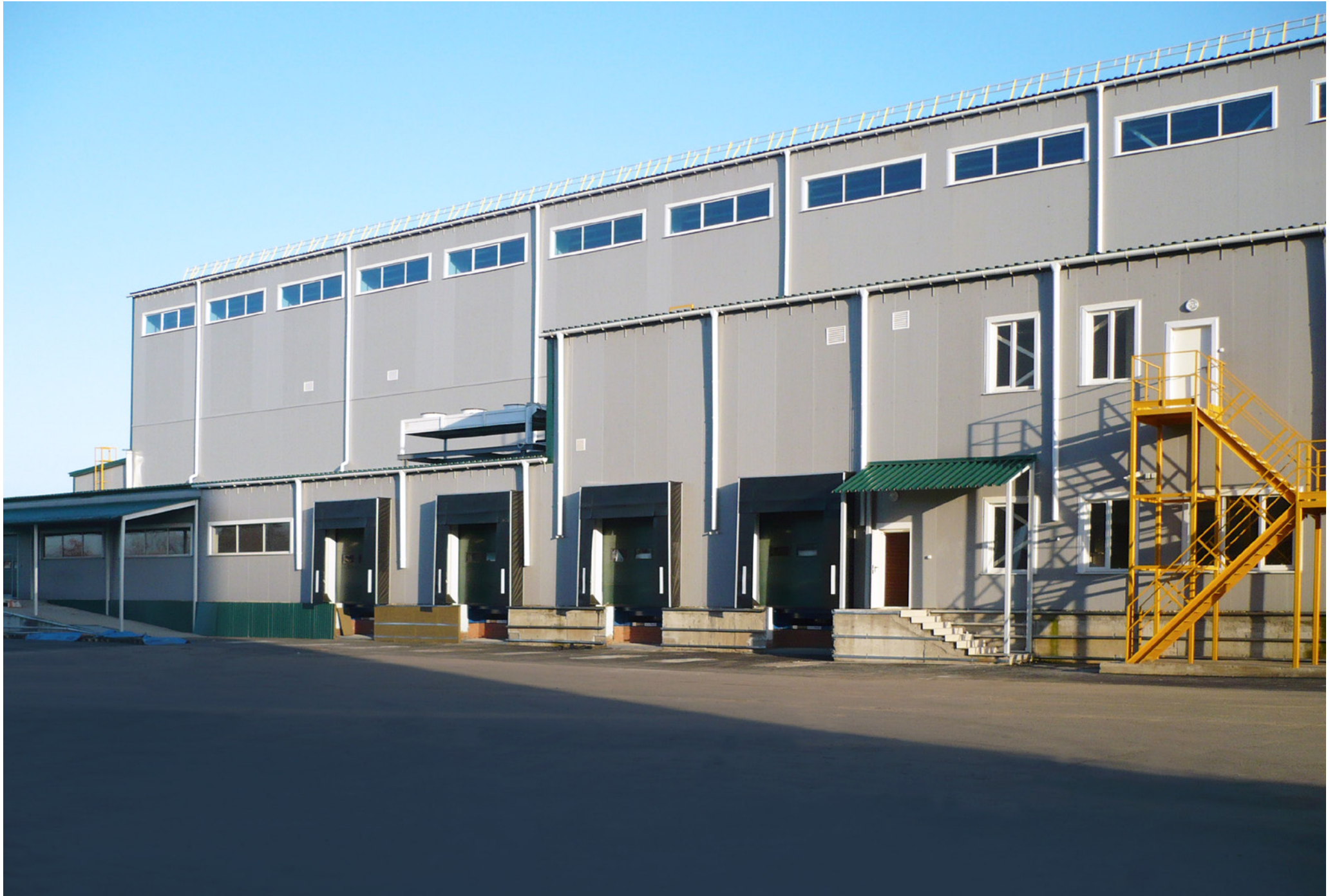
Storage Room of Finished Products; Pharmstandard; Kursk, Russian Federation; 2011