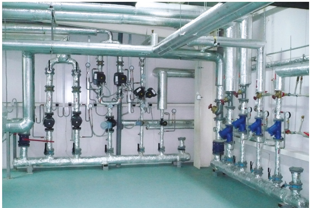
Storage Room of Finished Products; Pharmstandard; Kursk, Russian Federation; 2011