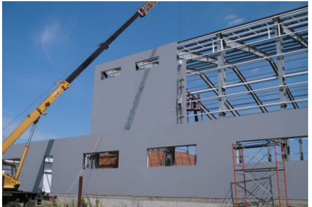
Storage Room of Finished Products; Pharmstandard; Kursk, Russian Federation; 2011