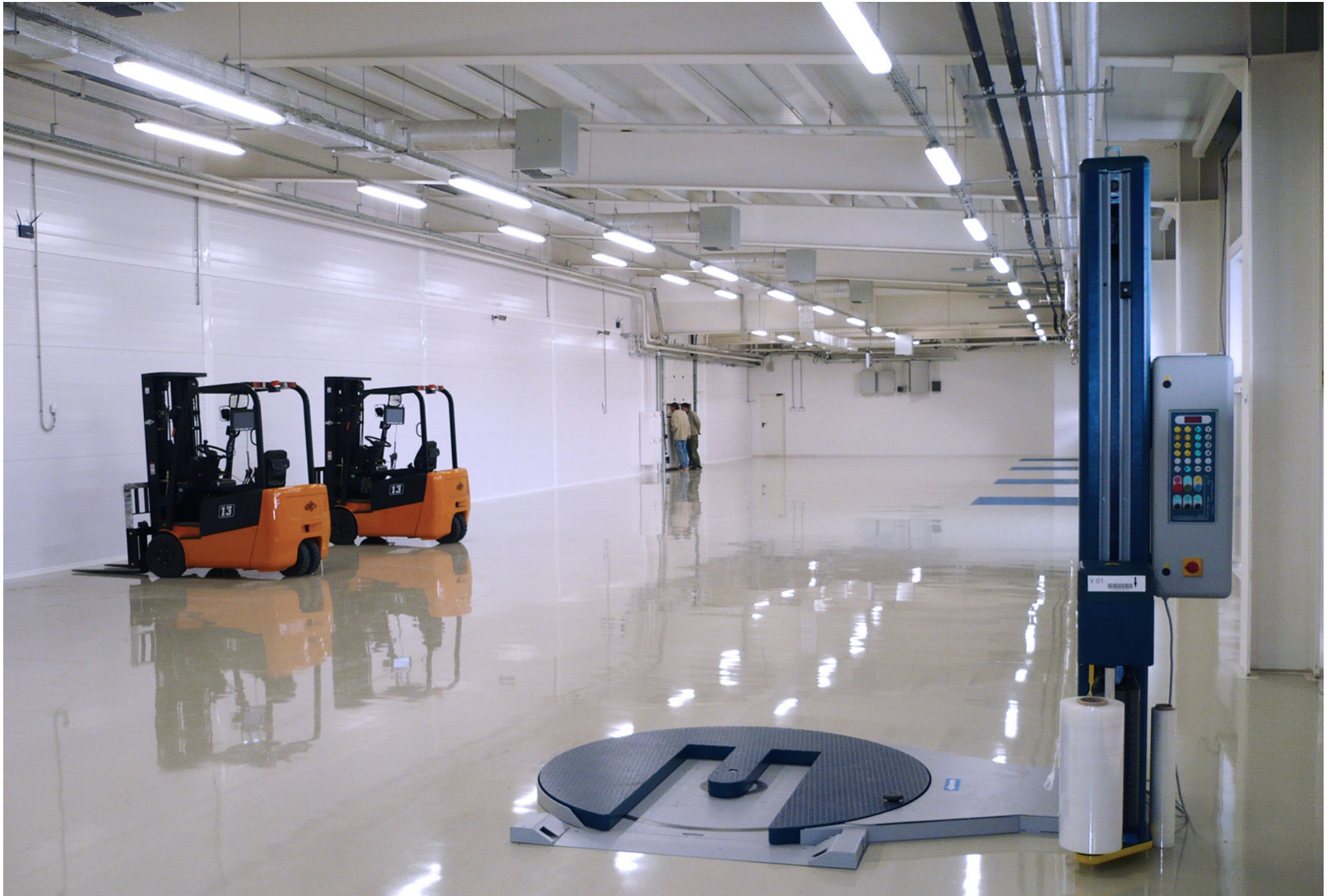
Storage Room of Finished Products; Pharmstandard; Kursk, Russian Federation; 2011