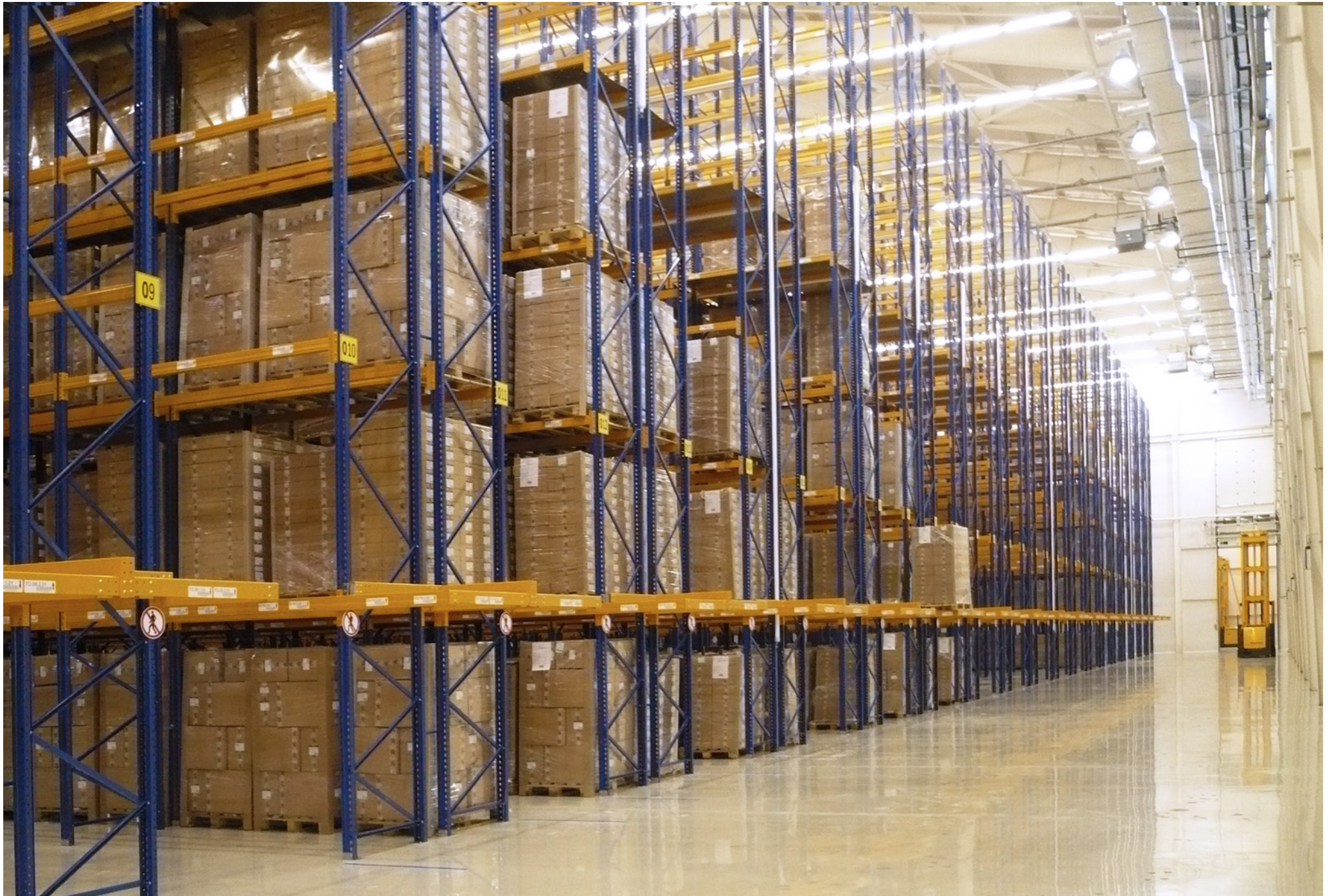
Storage Room of Finished Products; Pharmstandard; Kursk, Russian Federation; 2011