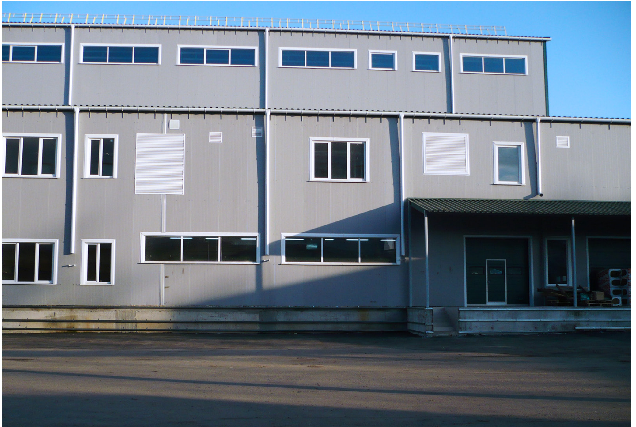
Storage Room of Finished Products; Pharmstandard; Kursk, Russian Federation; 2011